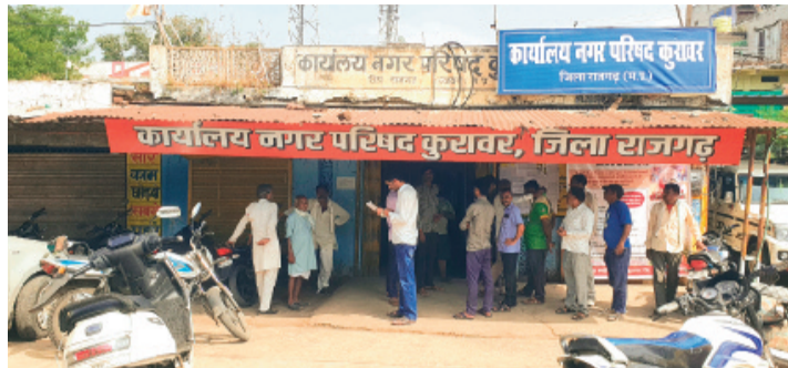
हरिभूमि न्यूज ▶▶ ब्यावरा/कुरावर

हर घर नल और जल पहुंचाने के सरकार के सपनों और वादों को यदि टूटा हुआ देखा है तो कुरावर आइए जहां पर बारिश के महिनों भी टैंकों से पानी लेने को मजबूर है नगरवासी। यहां पर जिस नलजल योजना को 2017 अगस्त से शुरू होकर अगले 850 दिनों में नगर की प्यास बुझाने का जिम्मा जिस कंपनी को सौंपा गया था वह अधूरा काम छोड़कर भाग गई। इसमें हैरत की बात यह है कि अधूरा काम होने के बाद नगरपरिषद कुरावर ने 2024 में अपने हंडओवर कैसे ले लिया जबकि आज भी 25 प्रतिशत काम नहीं हुआ है। फिर कंपनी का पेंमेंट कैसे हो गया यह भी प्रश्नचिह्न की जिम्मेदारों पर सवाल हो जाते हैं। कुरावर, बोडा और कोटरी; आधाके हाल यह है कि कंपनी ने पहले ही जरूरत के हिसाब से कम नल कनेक्शन कर अपने काम की इतिश्री कर ली कनेक्शन में जल की सप्लाई भी पिछले 2 महिनों से नहीं को पा रही है जिसका कारण कारण कुरावर-कालापिपल रोड के समीप खुदाई कार्य के चलते नल जल योजना के पाइपों को