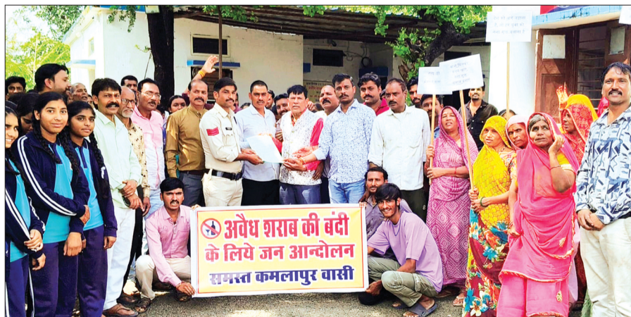
हरिभूमि न्यूज ►► चापड़ा

ग्राम कमलापुर में अवैध रूप से बिकने वाली कच्ची शराब पर प्रतिबंध लगाने की मांग को लेकर शनिवार को ग्रामीणों ने एकत्रित होकर जन आक्रोश के साथ नगर में रैली निकाली। रैली में बड़ी संख्या में क्षेत्र के महिला पुरुष शामिल हुए। ग्रामीण रैली के रूप में पुलिस थाना कमलापुर पहुंचे, जहां पुलिस थाना प्रभारी के नाम ज्ञापन दिया। ज्ञापन में बताया गया कि कमलापुर के कई लोगों द्वारा अवैध रूप से कच्ची शराब का विक्रय किया जा रहा है जिससे गांव के भोले भाले लोगों को शराब का आदि बना दिया गया है और शराब के सेवन से कई घरों