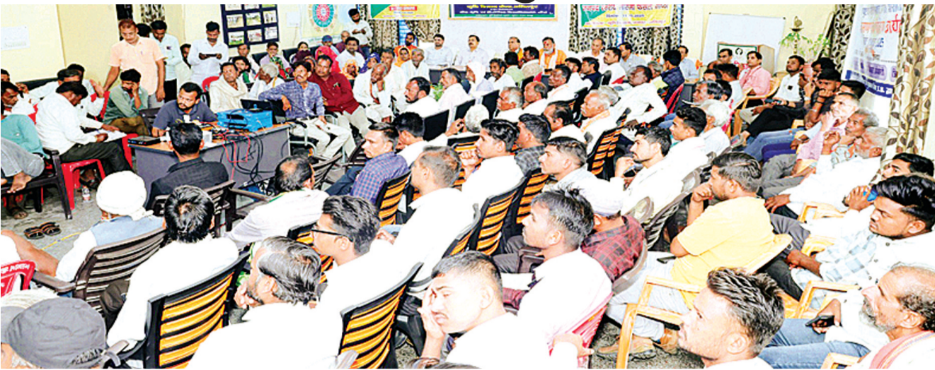
हरिभूमि न्यूज ॥ ललितपुर

प्रधानमंत्री धन धान्य कृषि योजना का शुभारंभ भारतीय कृषि अनुसंधान संस्थान नई दिल्ली से केवोंके पर किसानों हेतु सजीव प्रसारण किया गया। प्रधानमंत्री ने कृषि क्षेत्र के लिए 42 हजार करोड़ रुपये के व्यय वाली पीएम धन धान्य कृषि योजना समेत दो बड़ी योजनाओं का शुभारंभ किया गया। इसका उद्देश्य कृषि उत्पादकता को बढ़ाना, फसल विविधीकरण और टिकाऊ कृषि पद्धतियों को अपनाना,