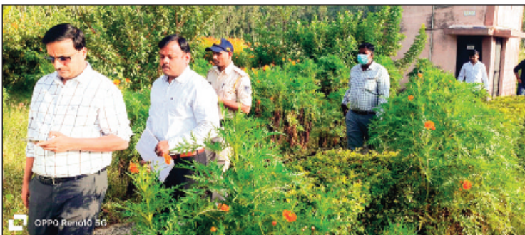
विदिशा। बेतवा किनारे के भ्रमण के दौरान भूमि का चयन करते हुए कलेक्टर व सीएमओ।

आकर्षक पर्यटन स्थल भी तैयार होगा। उन्होंने निर्देश दिए कि रिवर फ्रंट डेवलपमेंट में पर्यावरणीय संतुलन और प्राकृतिक सौंदर्य को प्राथमिकता दी जाए। इसी क्रम में नगर वन परियोजना के लिए भी भूमि का चयन किया गया। जहां नागरिकों के लिए हरित क्षेत्र, योग स्थल एवं ओपन एयर थियेटर जैसे सार्वजनिक उपयोग के स्थल विकसित किए जाएंगे। कलेक्टर ने अधिकारियों को निर्देशित किया कि भूमि चयन के बाद शीघ्र डीपीआर तैयार कर प्रस्ताव शासन को भेजा जाए ताकि परियोजनाओं पर कार्य शीघ्र आरंभ हो सके।